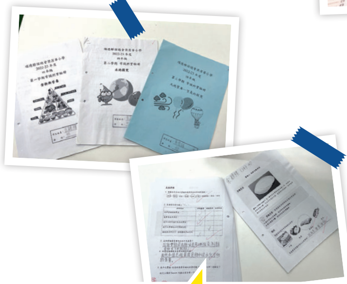
老師經教育局小學校本課程發展組(常識科)的悉心指導後，深入淺出地將科學概念結合日常生活例子授予學生，當中不乏冷知識及延伸閱讀，再加上實驗原理、步驟、實驗物料介紹等，綜合成一本內容專業且豐富的校本科學教材。