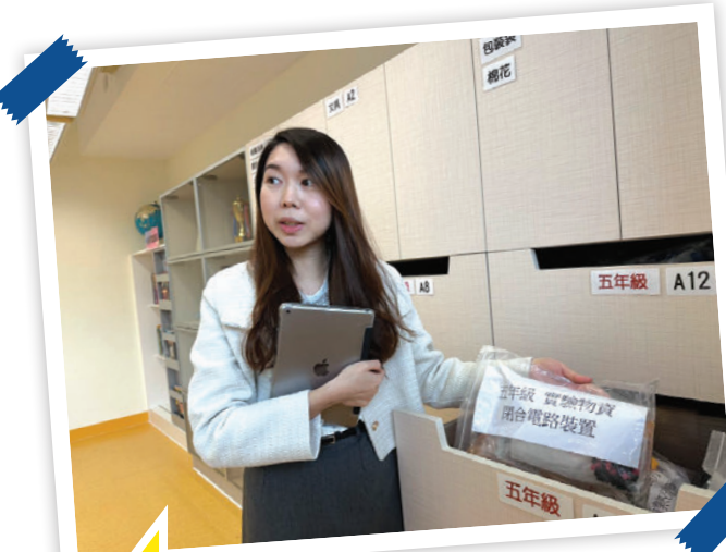
實驗材料按年級不同活動分門別類，每個年級都有屬於他們的櫃子，並附上清晰的標籤，一目了然。