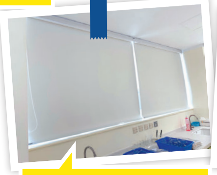
實驗室內的窗簾材質特別厚，當需要做一些在黑暗環境下的實驗時，就能有效阻擋光線。