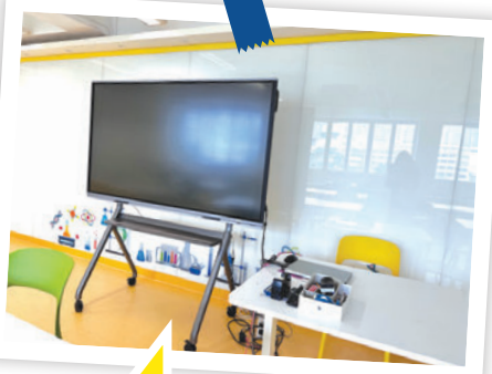
室內設玻璃白版及流動互動電子白板，方便老師展示教學內容及讓學生作小組匯報。

學校實驗室的配套充足，令人嘆為觀止，驚嘆老師們對科學實驗的嚴謹和力求專業的態度，各式各樣的設備應有盡有，井然有序地分類放在不同的櫃子內，學生可在老師的指導和輔助下，取得課堂需要的實驗工具。