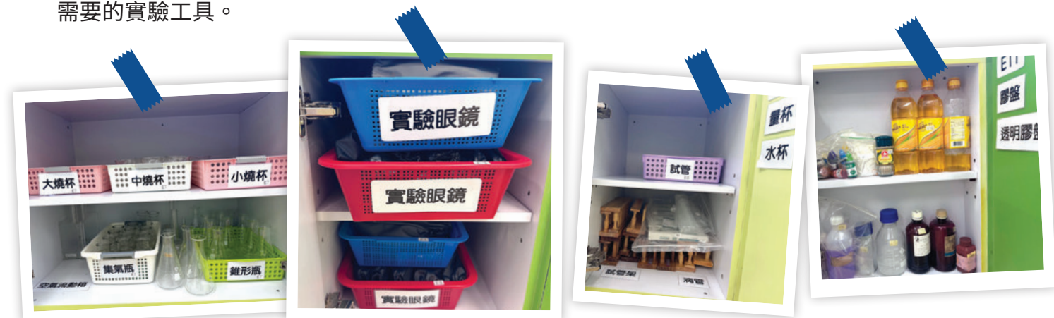
各級共用的實驗物料會放在牆邊地櫃內，透過清晰的標籤及編號，方便老師及實驗室助理存取及準備課堂活動。

學校實驗室的配套充足，令人嘆為觀止，驚嘆老師們對科學實驗的嚴謹和力求專業的態度，各式各樣的設備應有盡有，井然有序地分類放在不同的櫃子內，學生可在老師的指導和輔助下，取得課堂需要的實驗工具。