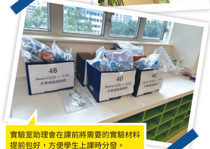
實驗室助理會在課前將需要的實驗材料提前包好，方便學生上課時分發。