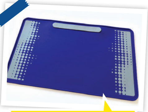
看似平平無奇的實驗墊，其實有防火、防滑、防腐蝕性的效能，可見學校非常重視學生的安全。