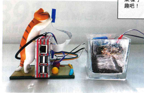
之前便有同學以貓貓製作外架樣子，蠻有趣吧！

他表示，該校推行 STEAM 的過程，也認為學習不該只集中於科學、常識、電腦、視藝等科，還可與各科知識結合，甚至結合生活經驗，從而解決日常難題。因此該校教授生命教育時，也希望於德育教育及中文科情意學習環節加入更多 STEAM 元素。正如該校尹少琴校長指出，加入 STEAM 元素，較易令到生命教育如此艱深虛無的課題具像化，變得更有意思，概念更加清晰，最重要是同學們也可以學得開心。