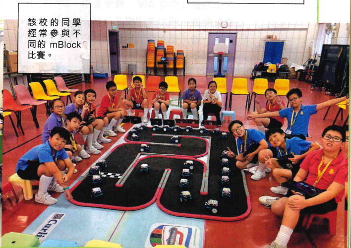
該校的同學經常參與不同的 mBlock 比賽。