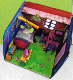
小五同學製作的智能房間，房中必須有一件設備是智能設備。